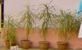
Chart Kava Krishna & Be Happy