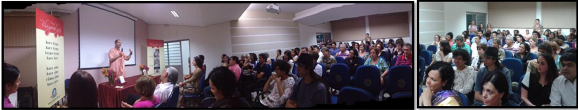
Event at SABSA was a success with more than 100 people at the audience. People stood up, as their number was above the local capacity Evento sediado na SABSA foi um sucesso de público com uma platéia de mais de 100 pessoas. Alguns assistiram a palestra de pé já que o número de pessoas estava acima da capacidade original.