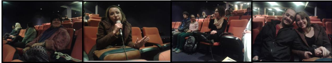
The Happy Audience enjoyed the lecture., made several questions and joined the sankirtan at the end of event. A platéia feliz gostou da palestra, fez várias perguntas e participou do sankirtan ao final do evento.