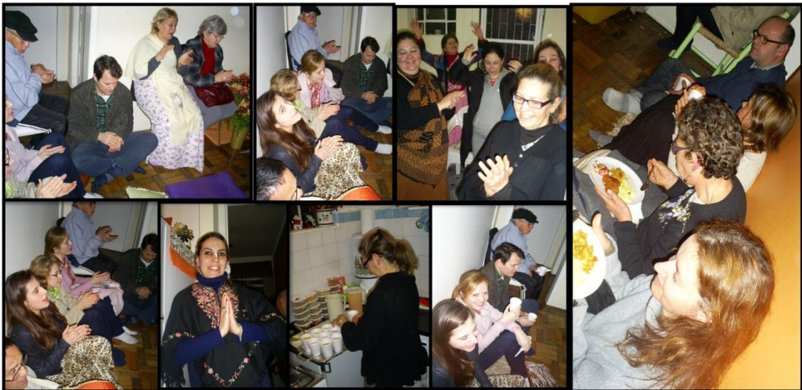
Left to right: Guests sang and dance during Sankirtan followed by delicious prasadam. Da esquerda para a direita: Convidados cantam e dançam durante Sankirtan, que foi seguido de uma deliciosa prasadam.

After the class we had a beautiful Sankirtan and then Prasadam was honoured.