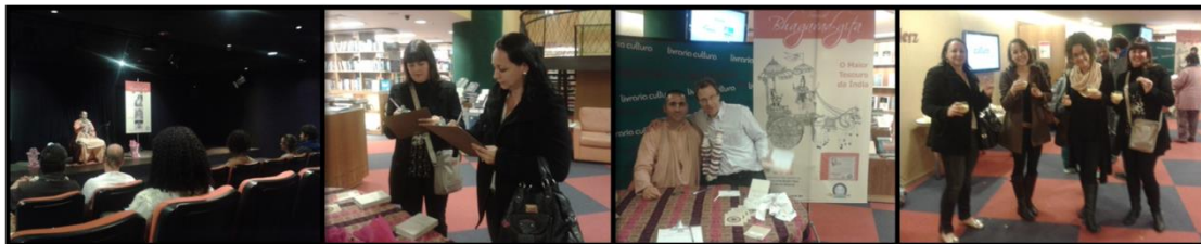
Part of audience on the Eva Herz Theatre Parte da platéia no teatro Eva Herz